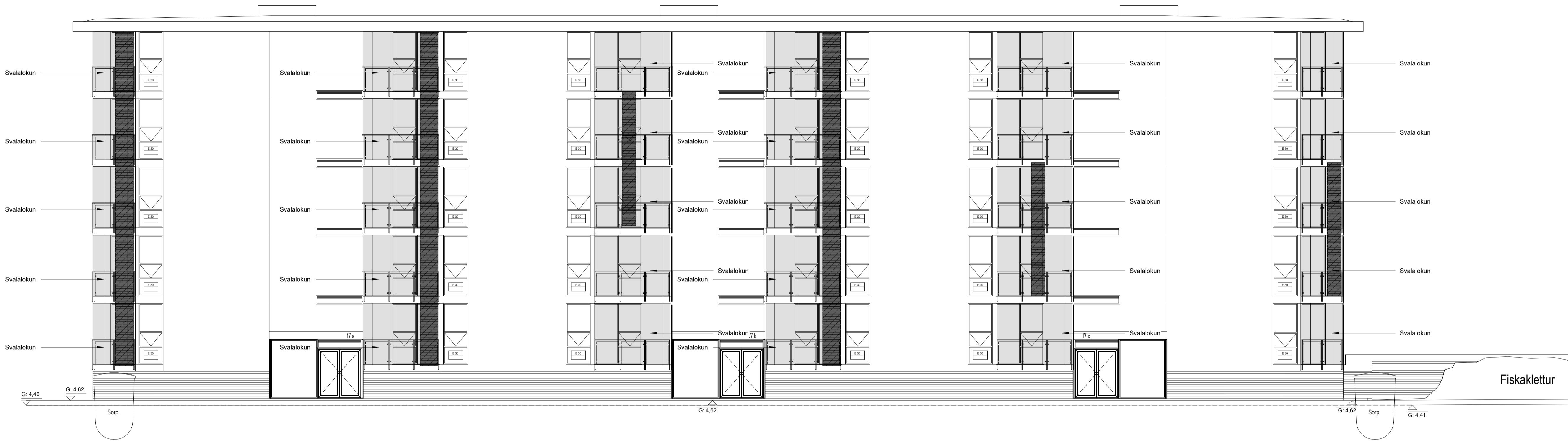
SUBAUSTURHLID 1 : 100