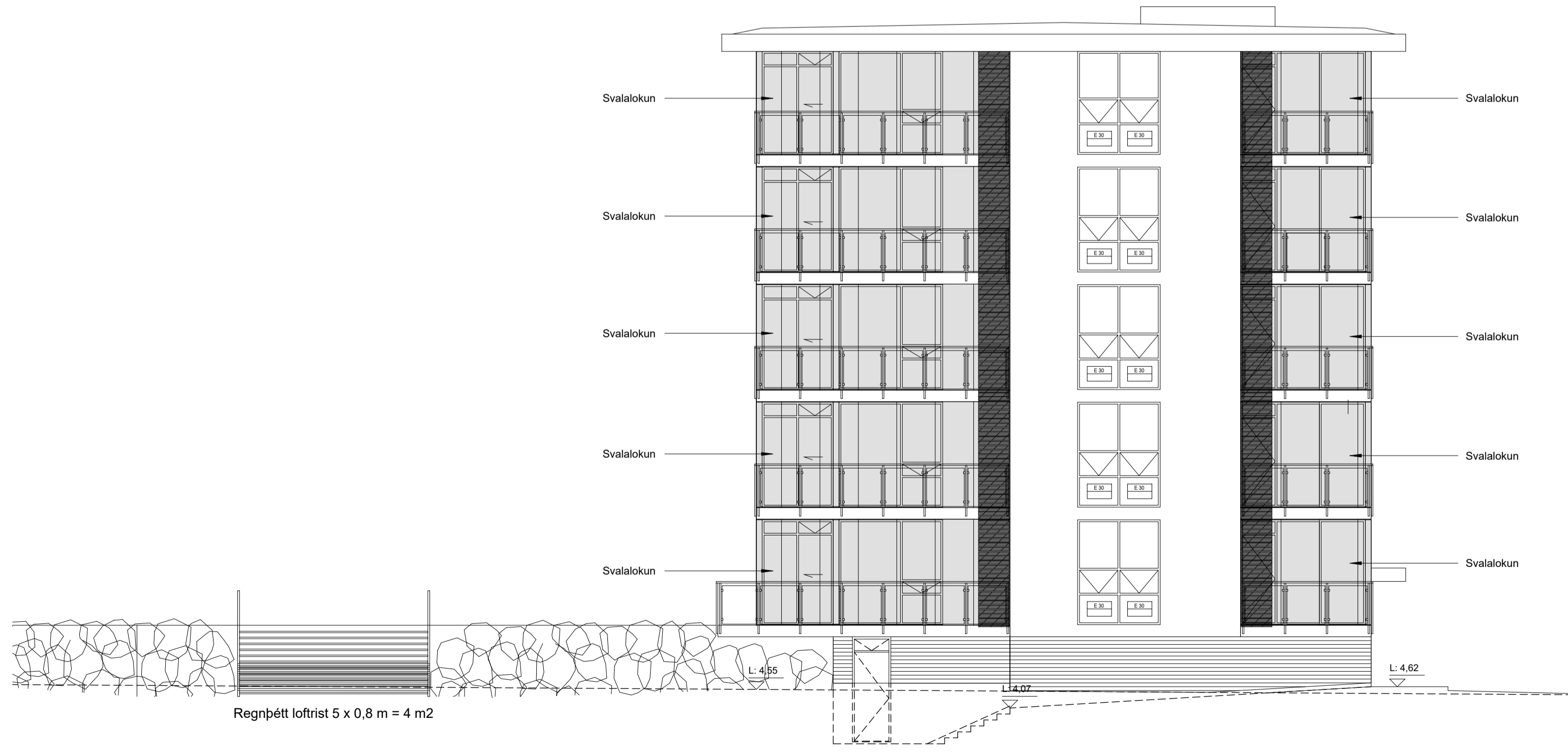
SUBVESTURHLID 1 : 100