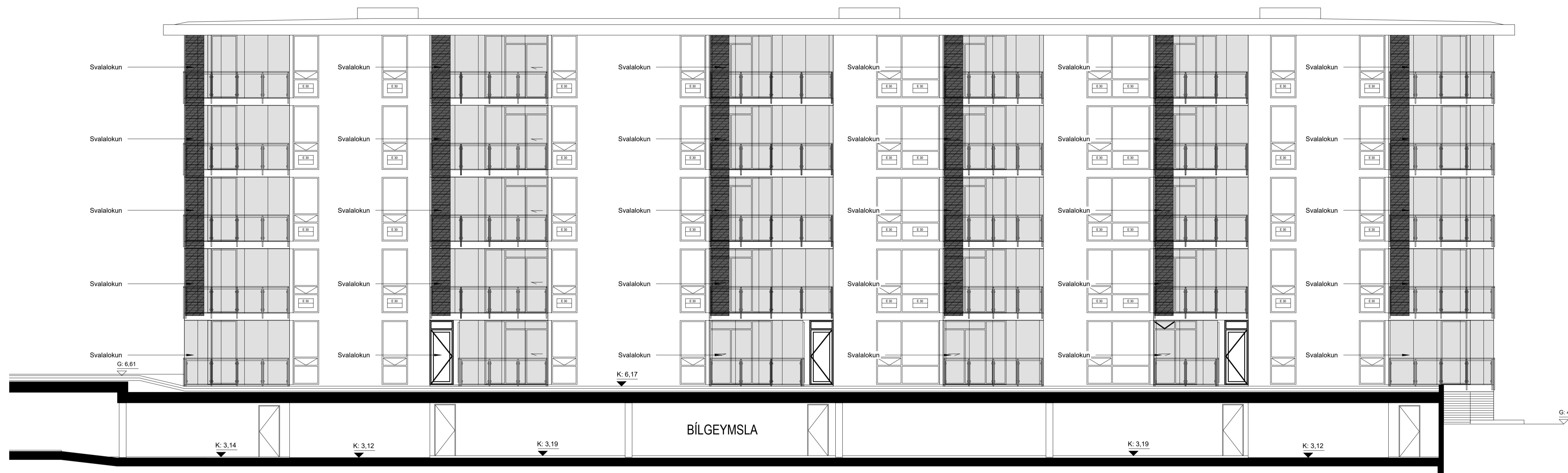
NORDEVSTURHLID 1 : 100